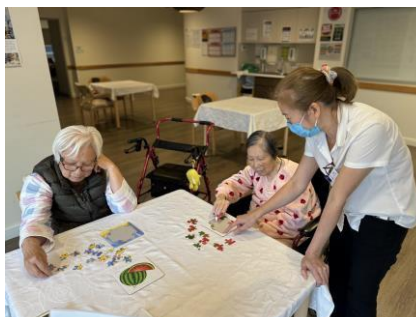
Chơi ghép hình