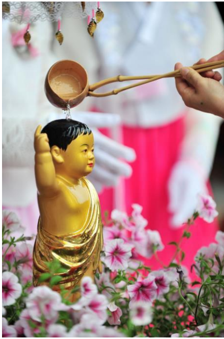
Hội trường được trang trí rất rực rỡ cho ngày Đại lễ Phật đản gồm hoa sen, hoa cúc xinh đẹp, hoa quả cúng và bánh chay tạo nên không khí lễ hội linh thiêng.

Vào Ngày Lễ Phật Đản 2024, viện AVACS chúng tôi đã biến thành một thiên đường vui vẻ và bình yên khi cư dân và nhân viên cùng nhau tưởng niệm ngày sinh, thành đạo và nhập diệt của Đức Phật Thích Ca Mâu Ni. Ngày lễ quan trọng này được Phật tử trên toàn thế giới tôn kính, có ý nghĩa đặc biệt đối với những cư dân cao tuổi của chúng tôi, mang đến cho họ cơ hội suy ngẫm, mừng kỷ niệm và kết nối với các di sản văn hóa và tinh thần. Ngày Vesak hay còn gọi là Phật đản, là một trong những lễ hội quan trọng nhất trong Phật lịch. Năm nay, nó đánh dấu 2568 năm kỷ niệm ngày sinh Đức Phật và được tổ chức vào dịp rằm tháng Năm.