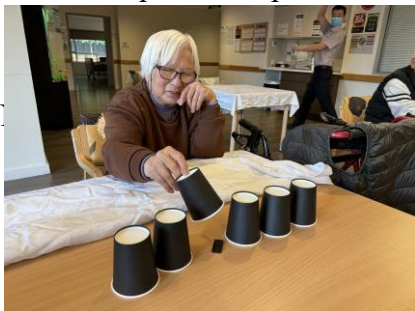
Trò chơi giấu tìm và tầm năng

Tại AVACS, chúng tôi tin rằng duy trì hoạt động tích cực và gắn kết là chìa khóa mang lại hạnh phúc cho cư dân của chúng tôi. Các hoạt động trong nhà đa dạng của chúng tôi được thiết kế để phục vụ sở thích và khả năng của mỗi cá nhân, đảm bảo rằng mọi người đều có cơ hội tham gia và tận hưởng. Từ nghệ thuật thủ công đến trị liệu bằng âm nhạc, trò chơi và các sinh hoạt xã hội chung, các chương trình của chúng tôi không chỉ mang đến sự giải trí mà còn nuôi dưỡng ý thức cộng đồng, có mục đích và niềm vui. Các chương trình trong nhà của chúng tôi đã mang lại sự ấm áp và hạnh phúc cho những cư dân thân yêu của chúng tôi.