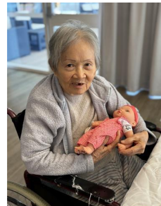
Chơi búp bê