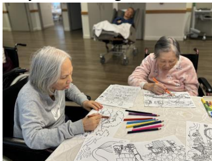
Nghệ Thuật Thủ Công